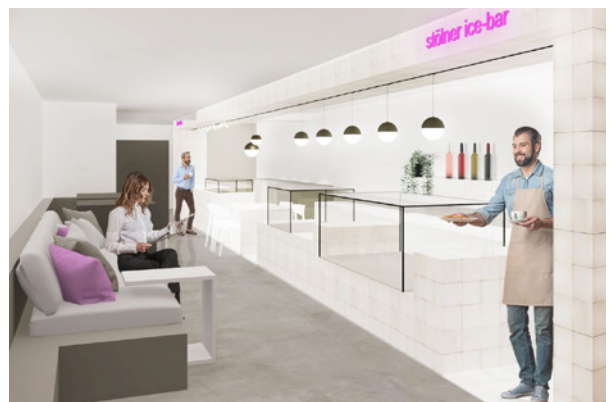
Das Wohlfühlambiente des Gelato Labs soll zum Verweilen, Diskutieren und Genießen einladen.